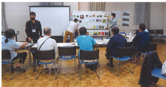
<第1回ワークショップの様子>