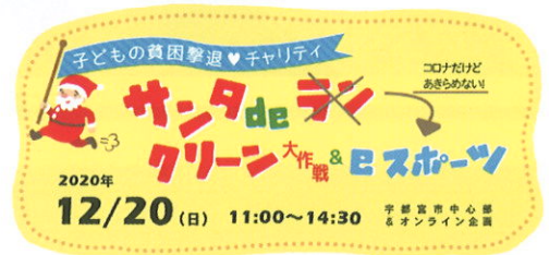
▲今年は12/20（日）、コロナ対策を講じながら実施いたします。