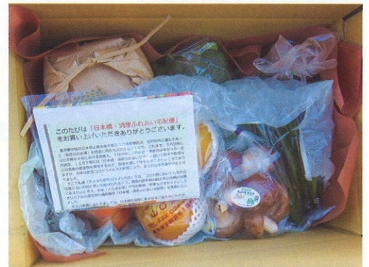
日本橋きよはらふれあい宅急便

大きくてピクリおいしくてにっこり栃木が産んだ巨大梨は糖度の高さと果肉の柔らかさが特徴です。冷蔵所に保存すればお正月まで美味しく召し上がれます。