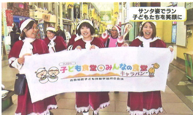
▲清原チームは昨年ベストドレッサー賞を受賞しました。