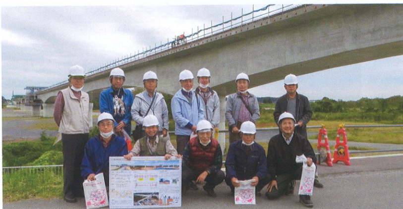
LRT整備特別委員会メンバー

参加者はLRT整備特別委員会10名の他、清原地区市民センター長、清振協会長、事務局長等、合わせ14名。工事の進捗状況としては、計画に基づいて現在のところ順調ということで、完成が待ち遠しい思いで終了しました。