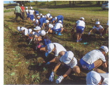
水辺の楽校 さつまいもほり