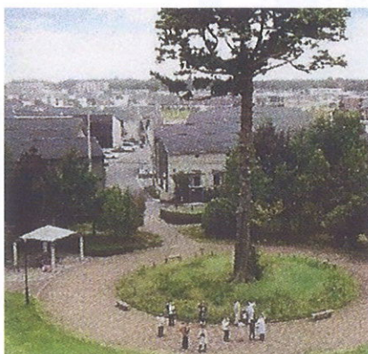
ゆいの杜地域のシンボル 一本杉