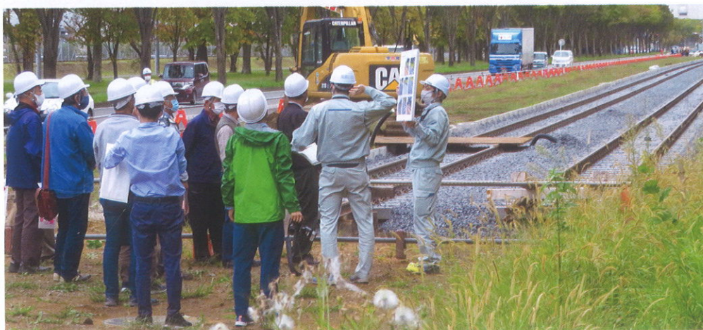
清原工業団地内レール敷設箇所の説明