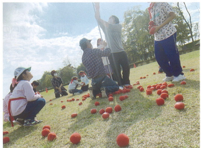
▲「子どもの居場所の運動会11/8」 たくさんの方々のボランティアの方々にお支援頂きました。