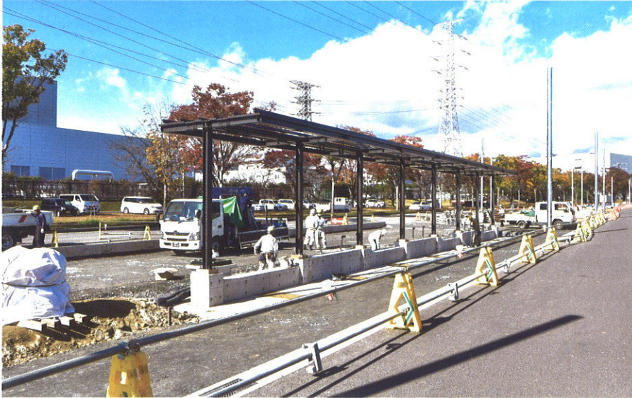
グリーンスタジアム付近停留場