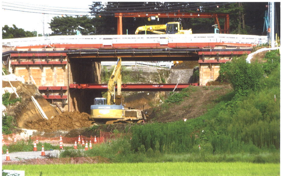
清原学園通りのトンネル工事