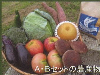
A・Bセットの農産物