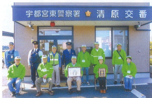
清原東地域防犯連絡協議会