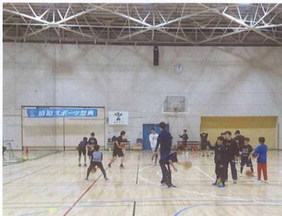
バスケットボール教室