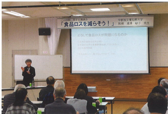
リサイクル推進連絡会研修会。

食品ロスを減らすには自身の適正エネルギー量を知り、バランスよく食べること。また、食品の知識・調理技術をもち、家族構成に合わせて食品を購入し、下処理をしながら上手に保存し、捨てないで食べきるということ。これを私たち一人ひとりが実践していくことが大切だと思いました。