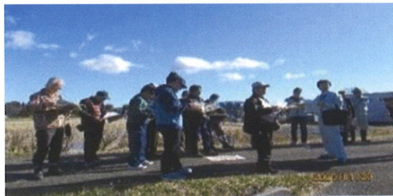
L R T委員会及び現地見学会