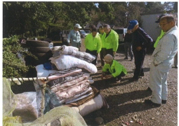
不法投棄パトロール