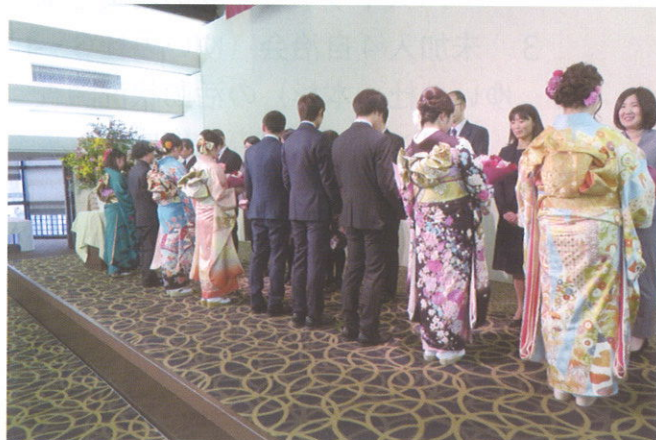
恩師への花束贈呈