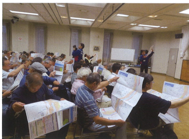
防災マニュアルー洪水対策出前講座

また、去年は台風による大雨に見舞われ、清原地区でも自主避難として清原地区市民センターや清原中学校に避難所が開設されました。しかし9年前の東日本大震災時と同様に、防災会でも避難所開設の知識がないため、避難されてきた方々に十分な対応ができませんでした。その教訓を生かすため、各町自治会長、自治公民館長、防災担当者等の方々を対象に、県防災士会の方々をお招きして「災害時における避難所開設訓練」を6月に実施する予定です。