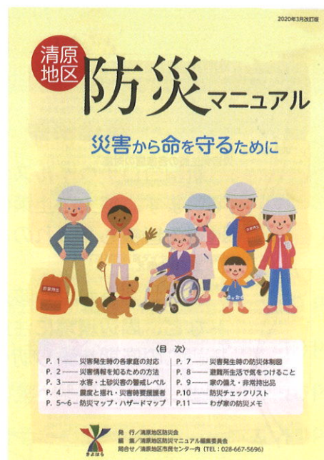
清原地区防災マニュアル（表紙）

さらに、防災マニュアルとは別に、災害時に自治会等や防災会がどのように対応したら良いかをまとめた、「区内対応行動指針」も作成しています。4月には防災マニュアル説明会の開催を予定していますが、その後に各戸配布を予定していますので、ご家庭の手の届くところに置いていただき、防災対応に活用していただければと思います。