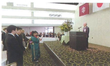
誓いのことば（成人者代表）