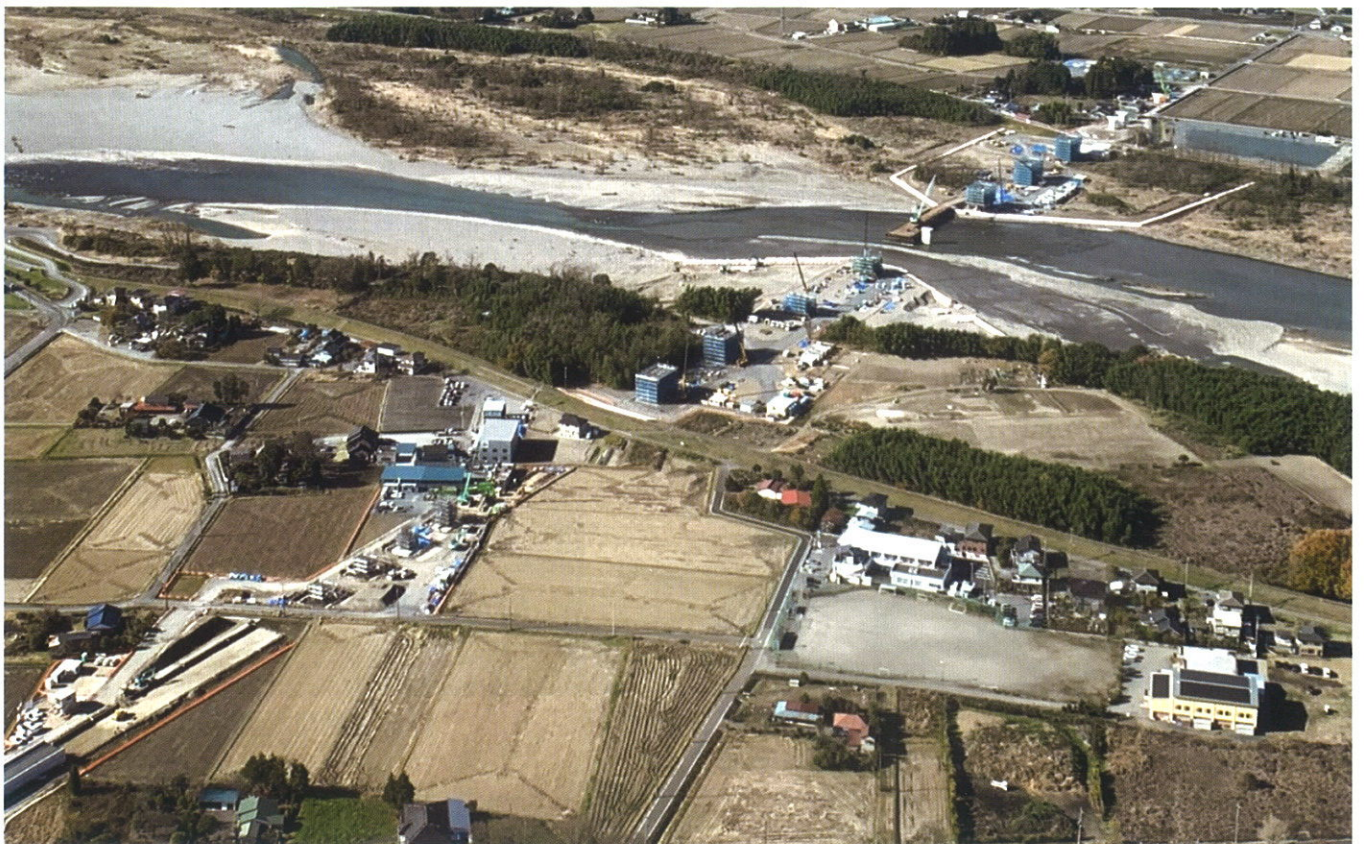
鬼怒川左岸（L R T工事が進む竹下町付近）