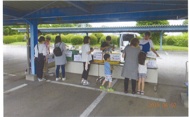
清原ブランド農産物の販売