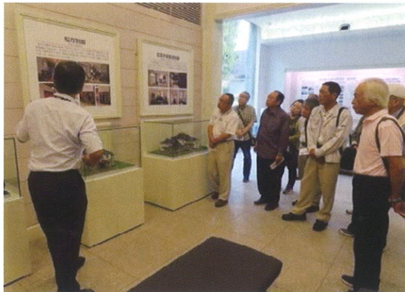
環境施設研修会（那須野が原博物館）