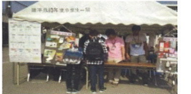
(写真1) 昭和まつり「分別クイズ」

昨年は、地域環境の啓発活動として昭和まつりに初出店参加し、「分別クイズ」を行いました。（写真1）おかげさまで、小学生を中心に延べ102名の皆さまにご参加いただきました。ありがとうございました。