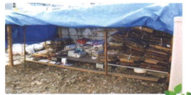
(写真2) 杉原尾上自治会「資源物集団回収ステーション」