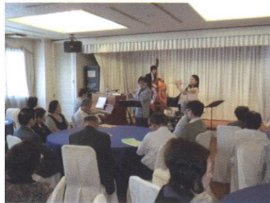
オープニングコンサート（5月）