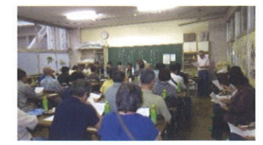
(写真3) 環境点検 2016.7.8