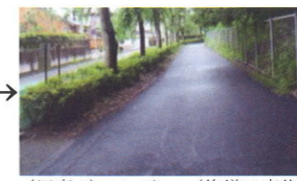
(写真2) アフター（修繕工事後）戸祭台地区：歩道の路面