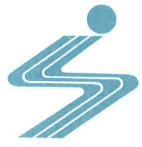
姿川地区シンボルマーク