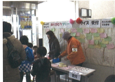
(ありがとうツリー)