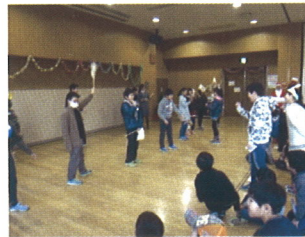
(ジャンケンゲーム)