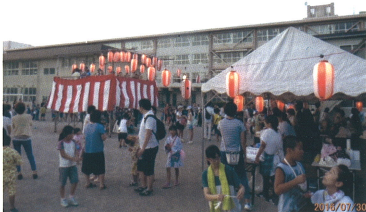
(地域一体となった納涼祭)

また、毎年8月末に、児童が快適に通学出来るよう小学校隣接地域道路の清掃を行っています。