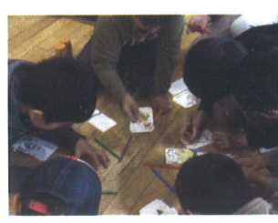
(クリスマスカード作り)