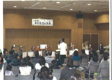
(姿川第一小吹奏楽)