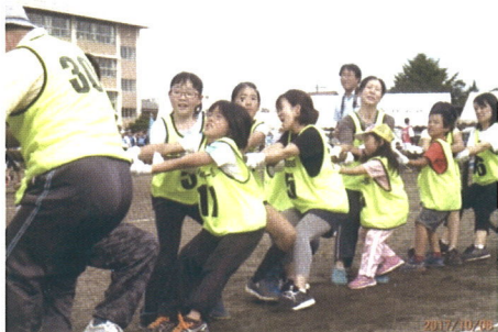
(地区体育祭でがんばりました)

その他の活動として、姿川地区体育祭、バレーボール大会、ソフトボール大会と若手を中心に参加しています。