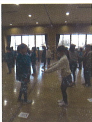
(ジェスチャー伝言)