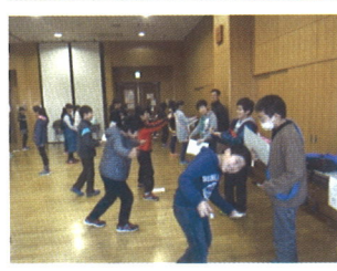
(ジェスチャー伝言)