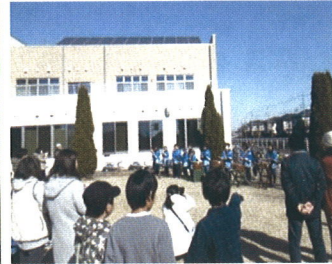
(西川田東部子どもお囃子)