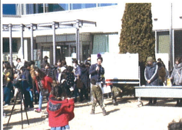
(ありがとう大声大会)