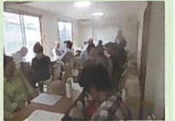
羽黒神社社務所をお借りして昼食