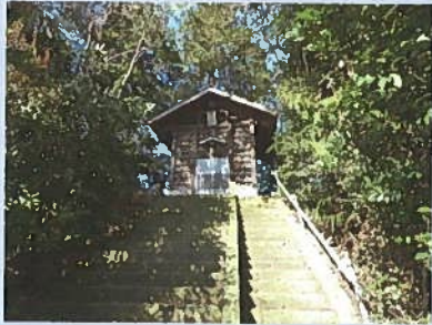
古墳の上に建つ砥上神社

下砥上中央街道の西側の畑の中に、直径 24.5m、高さ 5m の円墳がある。墳頂は、およそ直径 5m の範囲で平坦に整地され、砥上神社が鎮座し、墳丘の南側裾部あたりを削土して拝殿を建てている。境内には下砥上公民館がある。もと愛宕社を祀ってあったが、1911 年(明治 44)姿川寄りの水田にあった砥上神社と合併し、社号を砥上神社と称した。拝殿の裏側に石室の一部が開口しているが、今は中に入れないようになっている。この円墳は、横穴式石室に大きな切石を用いているので、7 世紀前半頃に築かれた古墳時代終末期の古墳として注目されている。