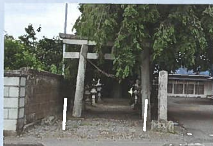
砥上神社鳥居(右手に古墳)