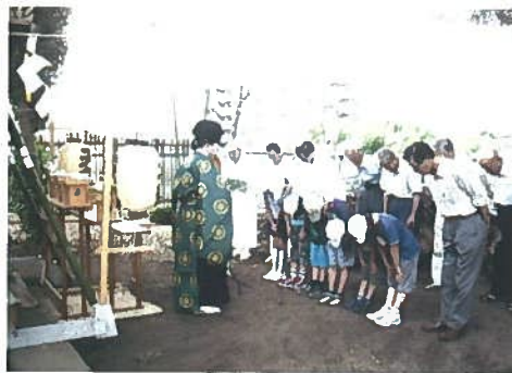
高麗神社の天祭の様子