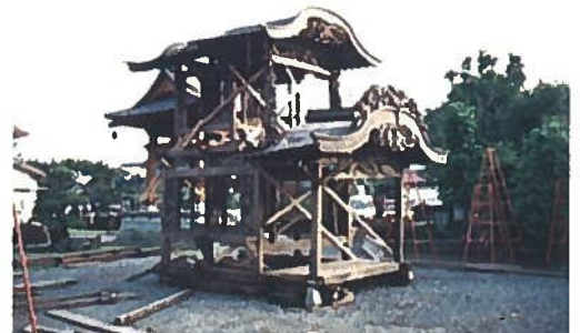
西川田天棚（光音寺）