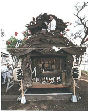
鶴田町天棚（高麗神社）

天棚にはそれぞれ豪壮、華麗な彫刻が施されており、製作者は東照宮宮大工と伝えられていたが、製作者の墨書が残っていないことから、日光造営・改修を手掛けた宮大工の流れをくむ、一般の大工の作という見方になって来ている。