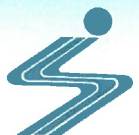
姿川地区シンボルマーク