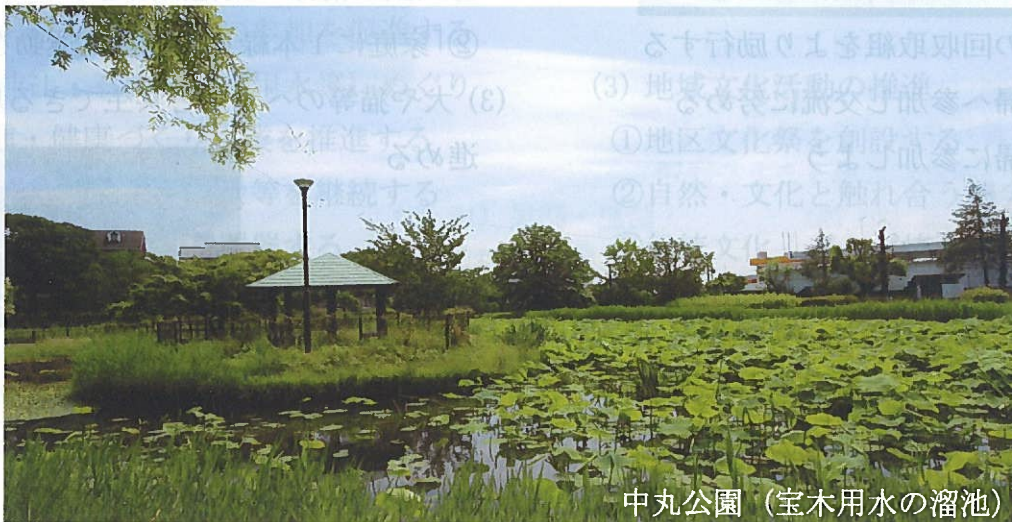
中丸公園 (宝木用水の溜池)