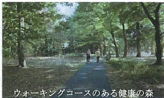
ウォーキングコースのある健康の森