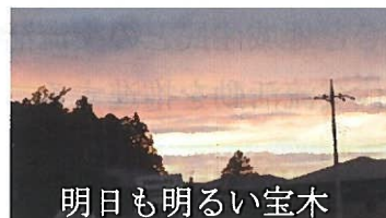
明日も明るい宝木