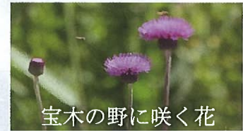
宝木の野に咲く花