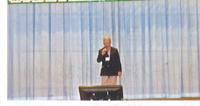
プロ顔負けの大熱唱