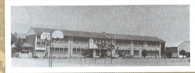
創立当時の星が丘中学校 (昭31.6)

戸祭地区の中心的存在である戸祭小学校ですが、創立当初は今の場所ではなく現在の星が丘中学校の場所にありました。