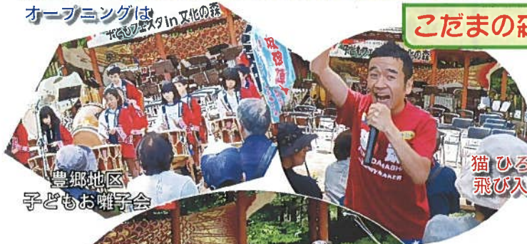
豊郷地区 子どもお囃子会