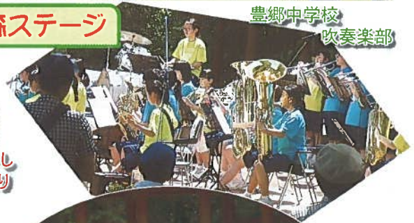
豊郷中学校 吹奏楽部