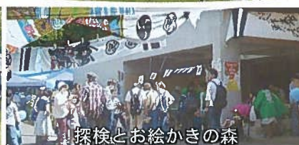
探検とお絵かきの森