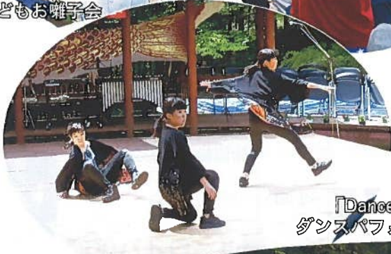
「Dance Studio BRes」 ダンスパフォーマンスのーコマ