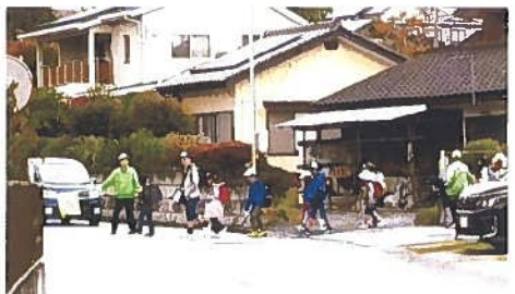
山本防犯パトロール

山本防犯パトロール隊は自治会役員、班長、子ども会、消防、体協、恵友会（老人会）による役員約 100 名により実施しています。子ども達の見守りを毎日下校時間帯に数名により立哨、毎月第 2 金曜日昼下校時間帯に山本交番に集合して児童の自宅近くまで送る、土曜日夜 7 時に山本交番に集合し役員、班長、隊員でパトロール実施。第 4 金・土曜日の毎月 2 回実施しています。（30 年度延 380 名参加）