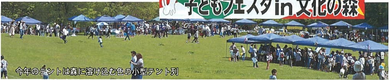
今年のテントは森に溶け込む色の小型テント列