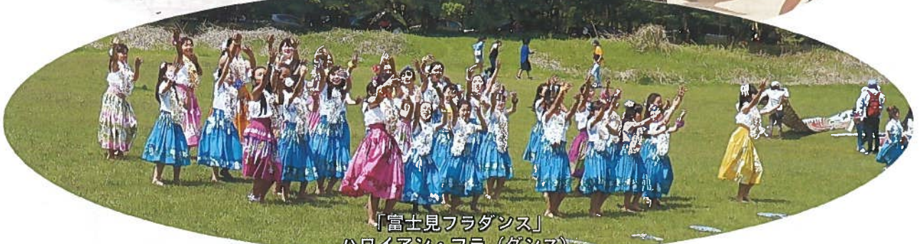
「富士見フラダンス」 ハワイアン・フラ(ダンス)