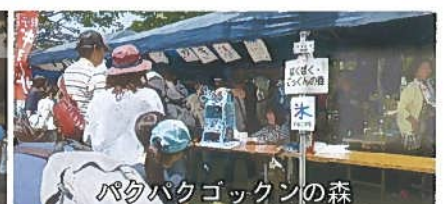
バクバクゴックンの森