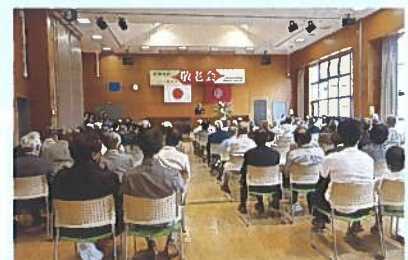
平成30年度の豊郷地区敬老会