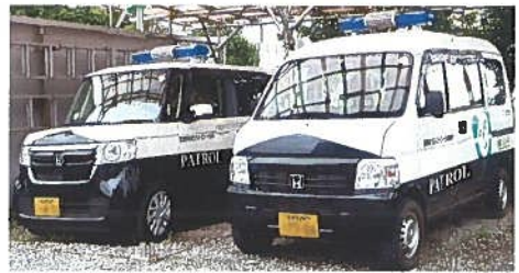
青色回転灯パトロール車

パトロール実施者を増やすための青色回転灯パトロール実施者講習会（毎年 6 月）を開催していますので、関心のある方はぜひご参加ください。