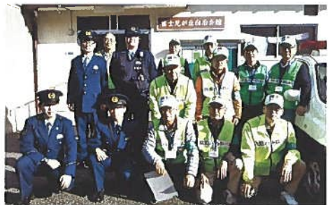
富士見が丘地域安全防犯パトロール

活動状況：1. 地域内の巡回 ・下校時の立哨・見守り、夜間パトロール ・青パトの巡回（月 3 回） ・地域安全歳末パトロール（山本町交番と連携） 2. 夜間パトロールの実施 ・民生・児童委員と連携して作成したマップを基に、一人暮らし高齢者の見守り活動 ・防犯灯の点検 ・違反広告物の除却活動等