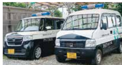
2台のパトロール車で地区内の安全を守っています。

豊郷地区連合自治会防犯パトロール隊は、専用のパトロール車2台を活用し、役員をはじめ各自治会長さんの協力により、毎日地区内のパトロール活動を実施しています。平成23年に任意団体として発足したパトロール隊は、地域の皆様のご支援をいただきながら実績を積み重ね、令和元年度に特定非営利活動法人（NPO法人）格を取得し、新たな歩み始めることとなりました。