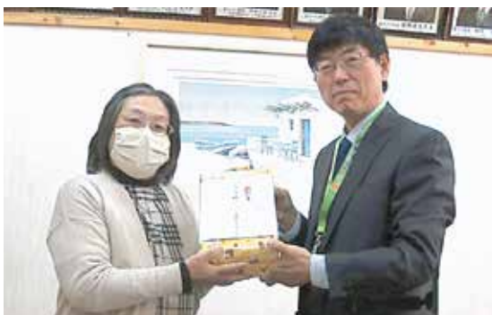
綱河会長と中央小の鶴見校長