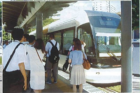
段差が小さい乗り降り