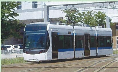
愛称「サントラム」超低床