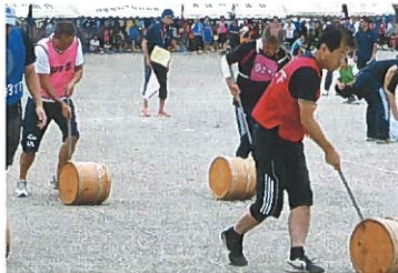
樽ころがしリレー