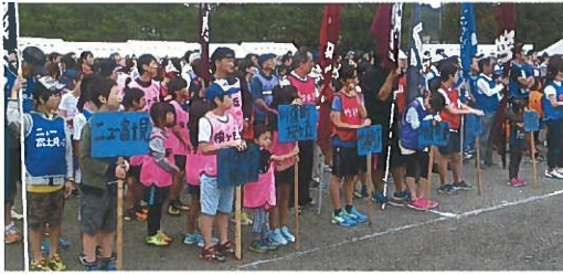
開会式で自治会毎に整列

今年の豊郷地区体育祭は予測できない空模様の影響を受け、1週間延期で9月9日(日)の開催でした。猛暑が避けられたのは幸いで、秋の始まりの一日、29自治会が参加した盛大な体育祭になりました。