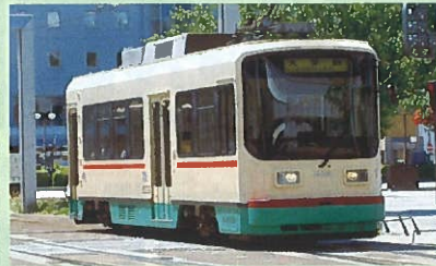
デ800形：富山市中心部用