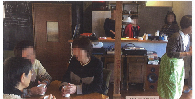
自治会のお祭り。近所の方々の共用部。