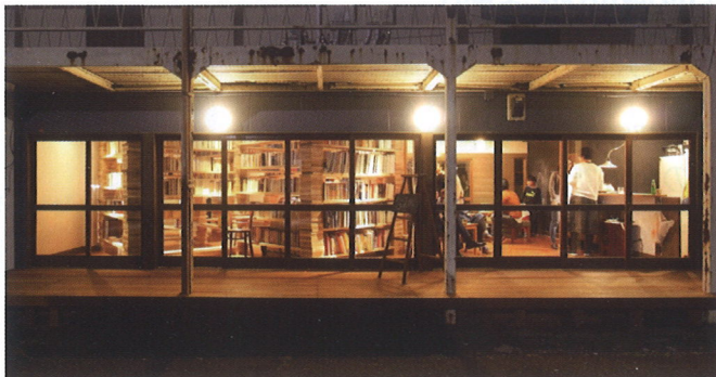
外観。路地に面して大開放。本の森が見えます。