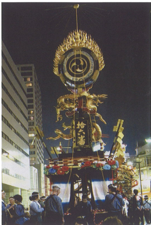
宮まつりに参加した時の火焰太鼓

左の写真は数年前、「宮まつり」で公開された新石町の火焰太鼓山車です。大通りの真中で両端のビルを威圧するかのような立派な山車です。