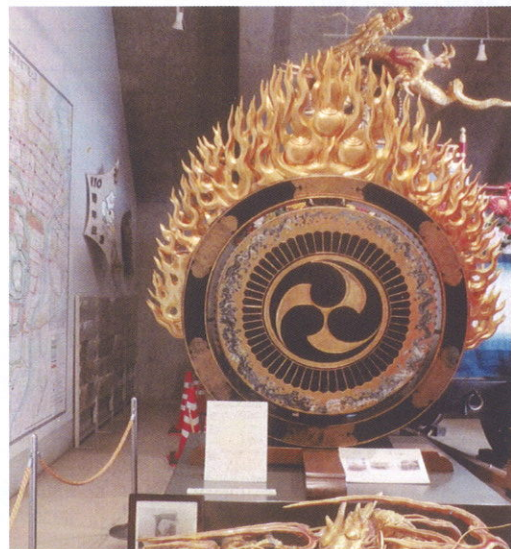
城址公園の火焰太鼓