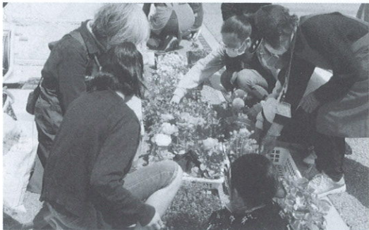
花の寄せ植えづくり