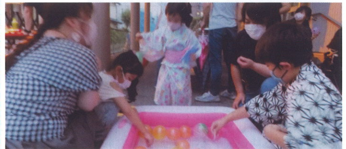
ヨーヨー釣りの様子