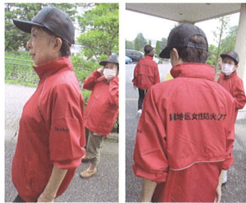
ユニフォームも新しくなりました

女性防火クラブに改称し心新たに地域の皆様のご協力を得ながらこれから頑張りますのでよろしくお願ひいたします。