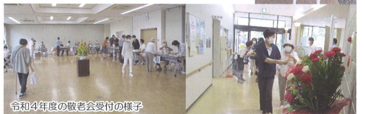
令和4年度の敬老会受付の様子