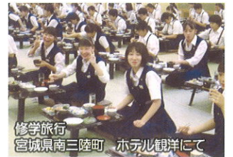
修学旅行 宮城県南三陸町、ホタル観賞にて

生徒はコロナ禍において、様々な活動ができることや、受け入れてもらえることに、感謝の気持ちを抱いています。これからも将来の社会を背負っていく中学生に、様々な学びの機会を整えていきたいと考えています。