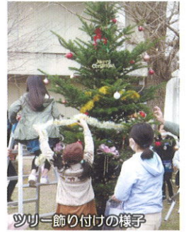
ツリー飾り付けの様子

12月になり三度目の感染が拡大する中、昇降口前に一本のモミの木を置かせてもらい、理事の皆さんと子ども達で飾り付けをしました。このツリーは今期私たちが「子ども達のために唯一できたこと」になってしまいましたが、ここに至るまでの議論はこれからの活動の力になると思っています。今後も子ども会育成会へのご理解とご協力をお願い申し上げます。