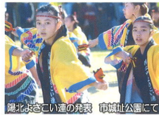
陽北よさこい連の発表 市城址公園にて

陽北中学校では、コロナウィルス感染防止対策にしっかり取り組みつつ、コロナ禍においても教育活動の充実が図れるよう様々な工夫し、生徒の健全育成に取り組んでいます。