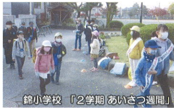
錦小学校 「2学期 あいさつ週間」

地域におきましても、児童たちが元気なあいさつができますようにご指導、お声掛けをいただければたいへんありがたいと思います。どうぞよろしくお願いいたします。