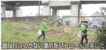
普段目につかない場所をパトロールしました