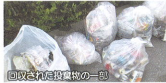
回収された投棄物の一部