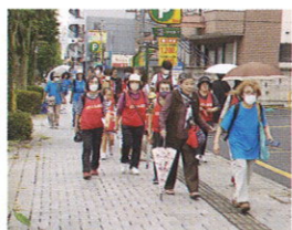
みんながんばって歩いてます