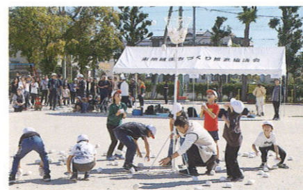
玉入れ親子対抗競技