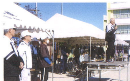
体協 又木会長 挨拶