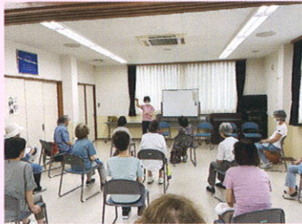
7/21 フレイル予防で健康長寿！