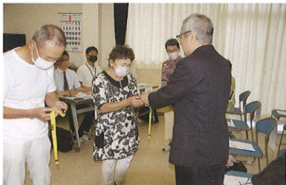
「にこサポサポーター」証明書交付