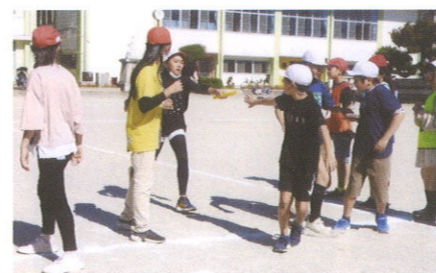
4チーム対抗リレー