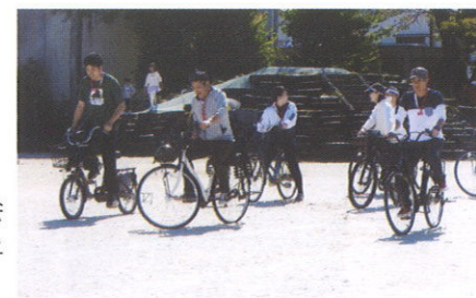
自転車おそりのり