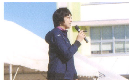
東小学校 平野校長 挨拶