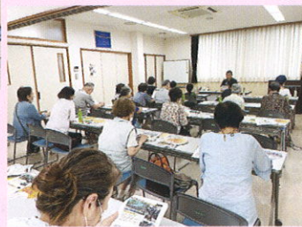
8/18 LRTの乗り方と 交通ルールについて