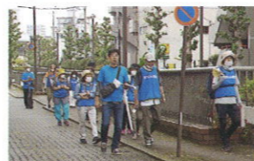
ロングでも和やかに疲れ知らず