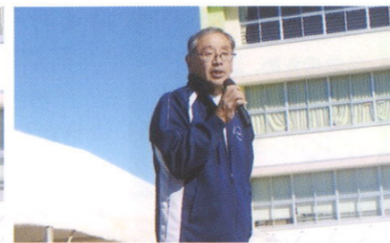
体協 大門事務局長 挨拶