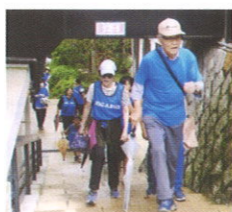
二荒山神社女坂を登ったところです