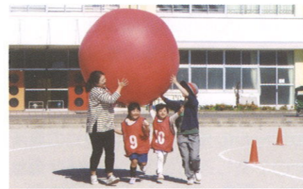
玉運び もう少し頑張って!