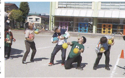
パン食い競走 大苦戦