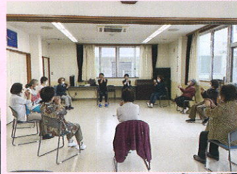
10/20 座ってできる シニア体操