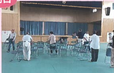
東小の子どもたちと地域の方々が会場準備をしてくれました。