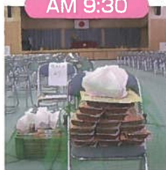
お赤飯が届きました。