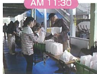
引きかえにきました。