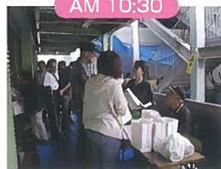
それぞれのもち場で用意します。