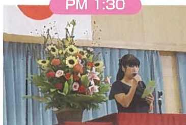
宇都宮市民憲章唱和