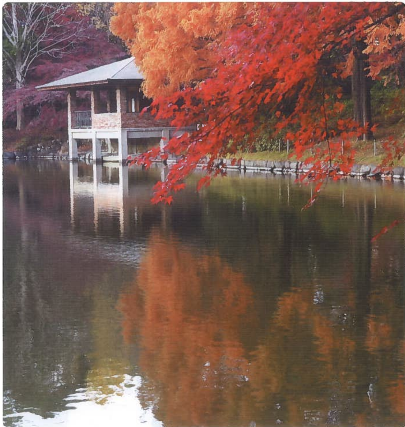
秋を彩る中央公園 昭和大池の風景（1982年10月開園）