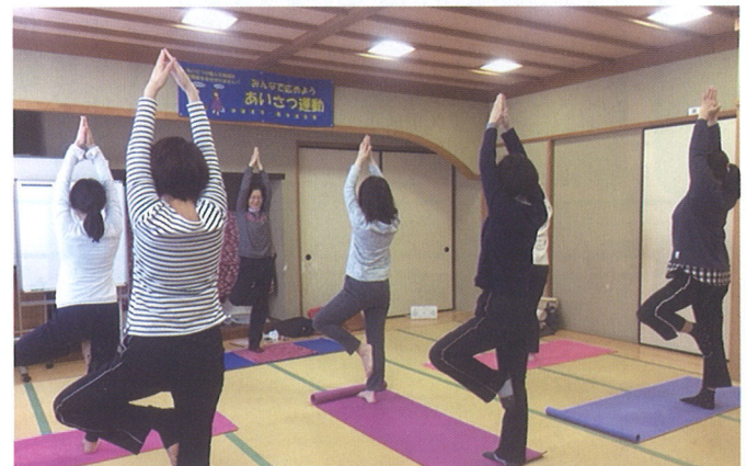
富士見ヨガこすもす