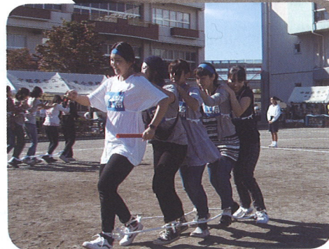
◀ 足どりあわせて イチニー イチニー