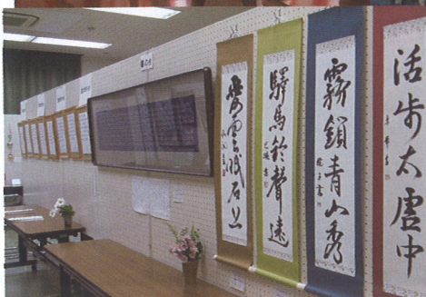
◀ 文化祭の華 作品展示