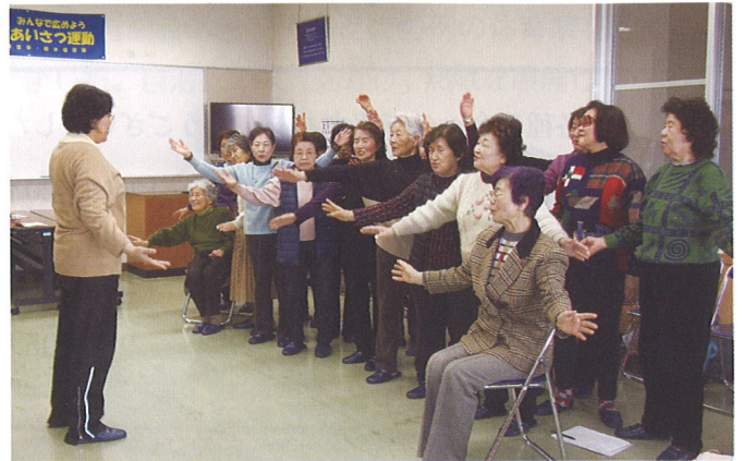
富士見婦人会コーラス部