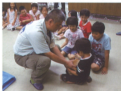
動物と仲良く (宇都宮動物園長の講演) 7月22日