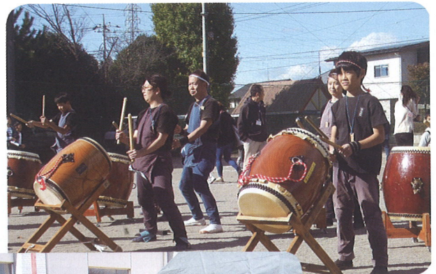
▶ 日ごろの練習の成果だぜ! ◀ お父さん頑張る おいしいよ