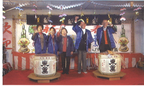
福祉協力員を中心に 地域交流事業 (酒蔵を訪ねて鏡割り) 1月31日