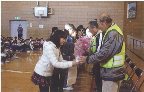
子ども達から感謝の贈り物 (12月20日)