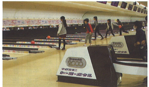
ボウリング大会 (12月23日)