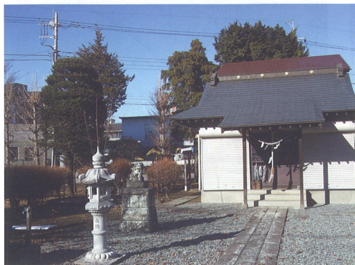
静かなたたずまいをみせる瀧尾神社