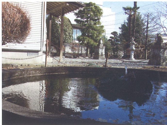
宇都宮七水の一つ「滝の井」