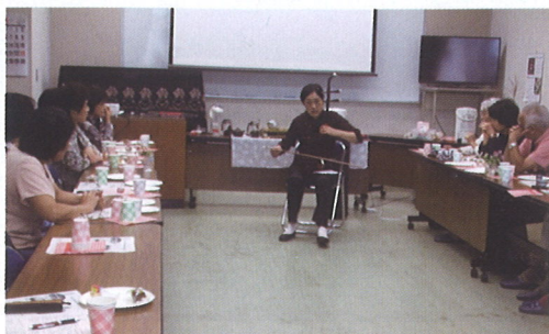
国際理解を深めよう 二胡を鑑賞 (9月28日)