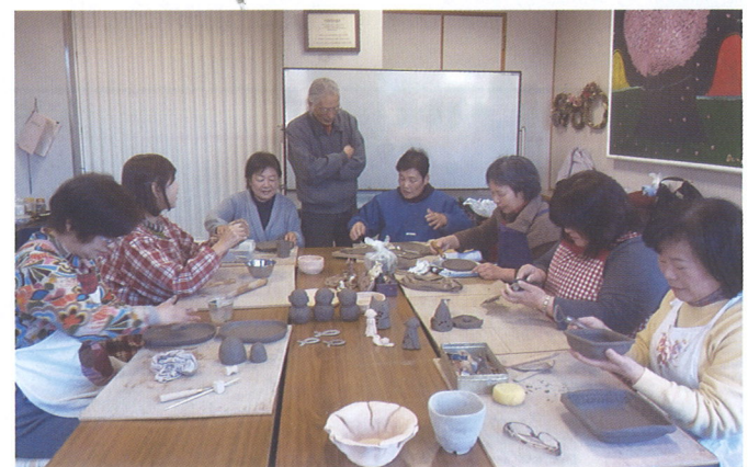
富士見陶芸クラブ