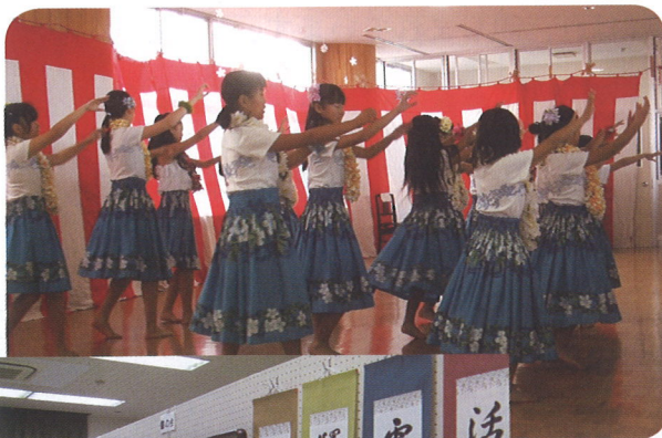
◀ 足どりも軽く フラダンス

「文化の薫る美しいまち」を目指し、子どもから高齢者の方々まで、多数の参加をえて、文化祭が開催されました。