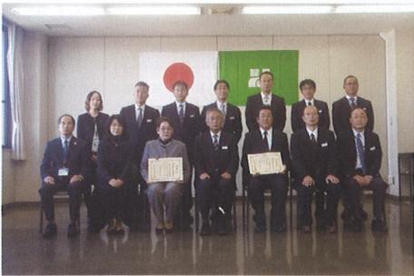
道路清掃・美化活動・ 感謝状を受理 (宇都宮土木事務所長から) 11月29日