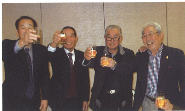
和気あいあい 乾杯!