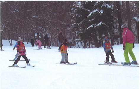
たのしいな スキー教室 (2月3日)