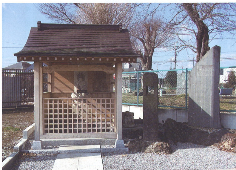
区画整理により移転した現在のお宮