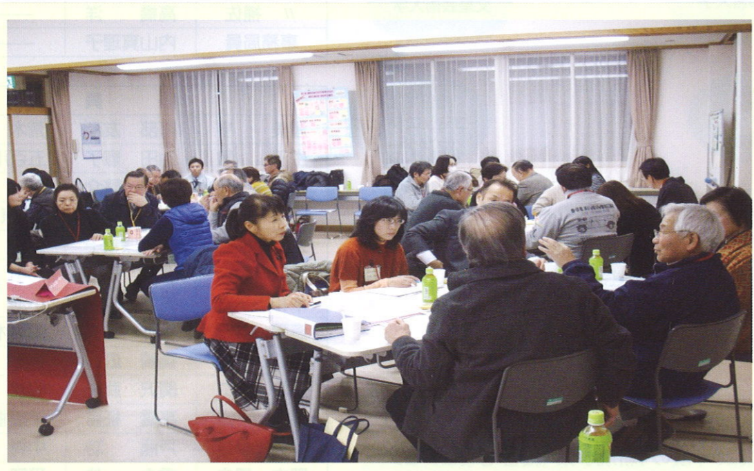
平成29年1月26日 (木) 第8回 ビジョン検討会議 分野別グループワーク

わたくしたちの住む、この細谷地域を 10年後、20年・30年後も 「暮らしやすいまち」「住みやすいまち」 「住んでいてよかったまち」 「これからもずっと住み続けたいまち」で あり続けるために・・・ 将来、どのような「まち」にしたいのか