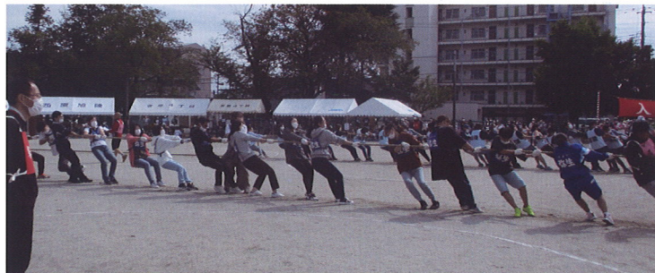
自治会対抗綱引き