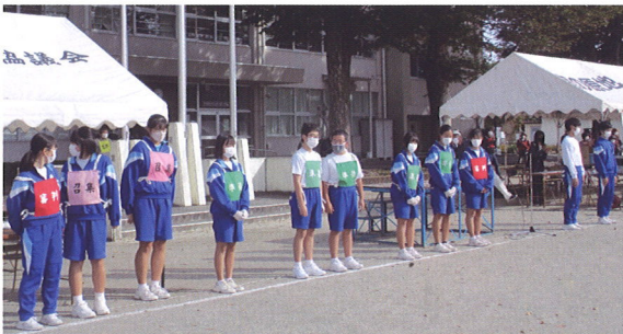
一条中ボランティア