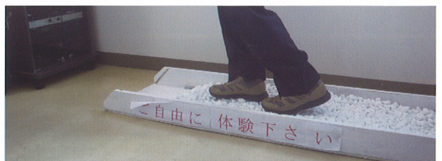
音が出る砂利体験

各自治会・団体・防犯ネットワークの方々に参加していただき、5班に分かれて区内を回りました。空き家の樹木が生い茂った所や暗い所など関係機関に改善をお願いしました。