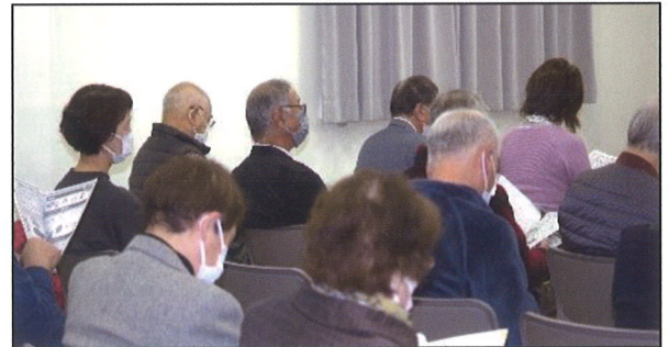
懇談会に参加の築瀬地区のみなさん