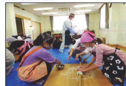
11/6(土) 手打ちうどんに挑戦!