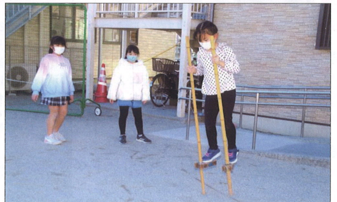
みて!みて!の・れ・た・よ!竹馬