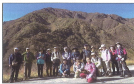
5/6(木) 日光茶ノ木平ハイキング