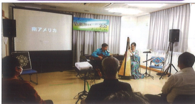
築瀬地区音楽会 10月11日(月) ♪月コンドルは飛んで行く・コーヒールンパ♪