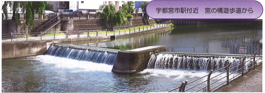
宇都宮市駅付近 宮の橋遊歩道から