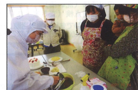
12/24(金) ケーキのデコレーション