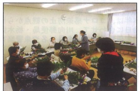
12/8(水) 壁掛け スワッグ作り