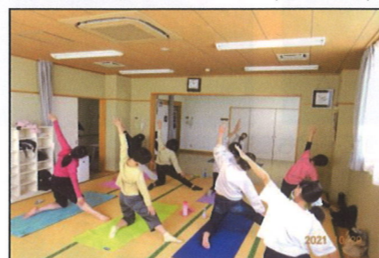
10/20(水) ヨガでリラックス