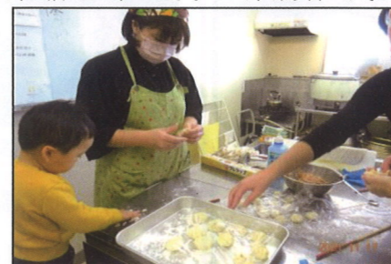
11/17(水) 台湾料理 小籠包作り