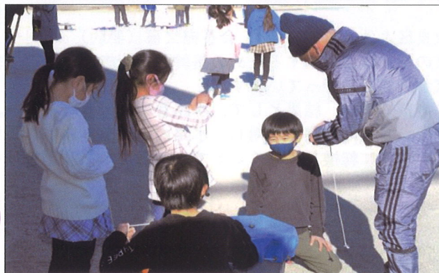
昔あそび(築瀬子どもの家) 1月7日 地域の方々に、いろいろ教えてもらいました。 伝承される遊び(竹馬・ベーゴマ・羽根つき・竹とんぼ etc)