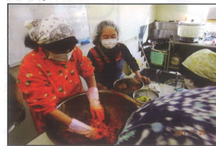
11/24(水) 美味しいキムチ作り