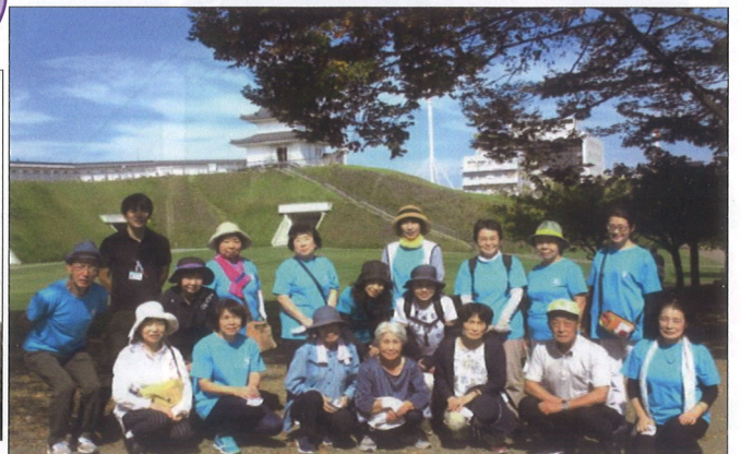
健康ウォーキング 宇都宮市城址公園