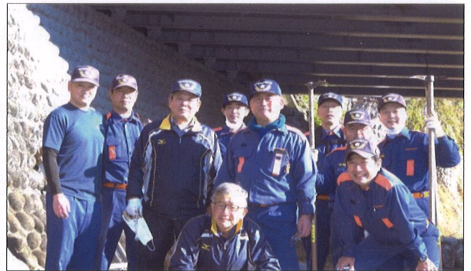
田川を守る地域の方々 (7月・9月・11月・12月) まだまだ、台風19号の爪痕が残っています。