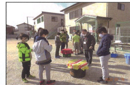
1/15(土) 昔あそび（ベーゴマ）