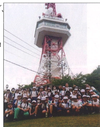
築瀬地区子ども会連絡協議会