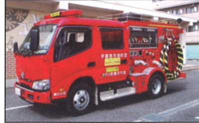
新しくなった車輜