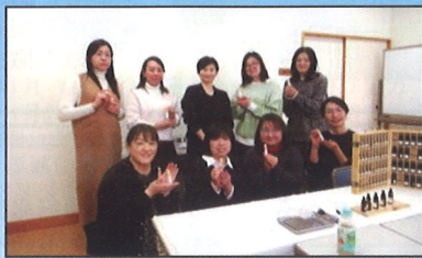
1/21(水)ロールオンアロマ作り