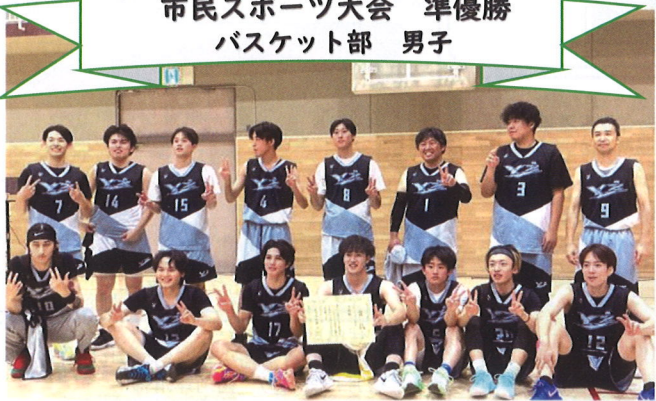
市民スポーツ大会 準優勝 バスケット部 男子