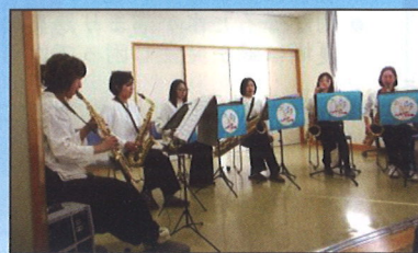
1/14(水)新春コンサート