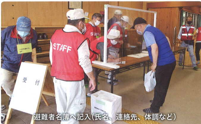
避難者名簿へ記入(氏名、連絡先、体調など)