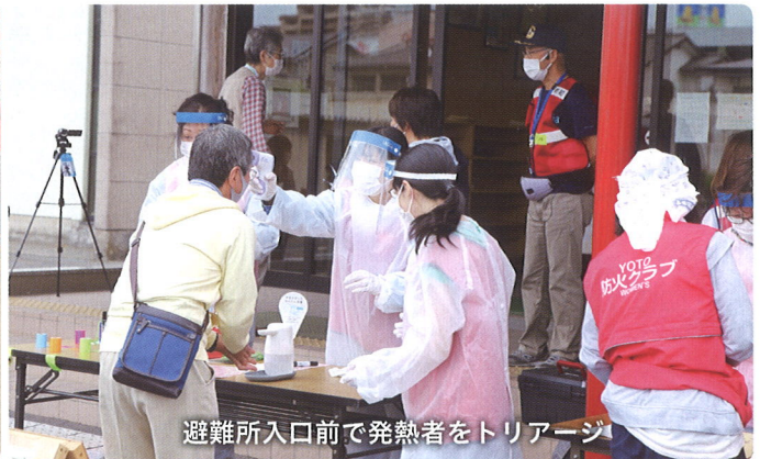
避難所入口前で発熱者をトリージ