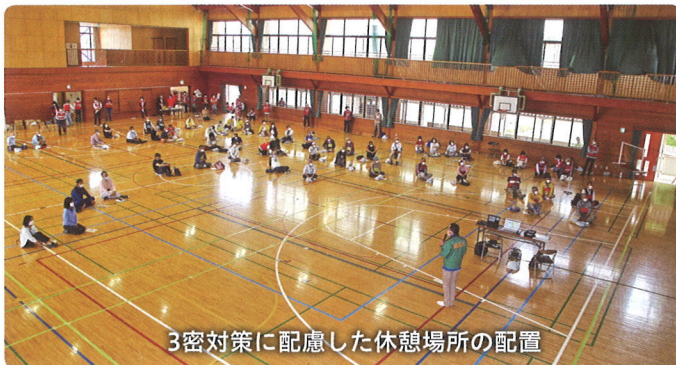
3密対策に配慮した休憩場所の配置