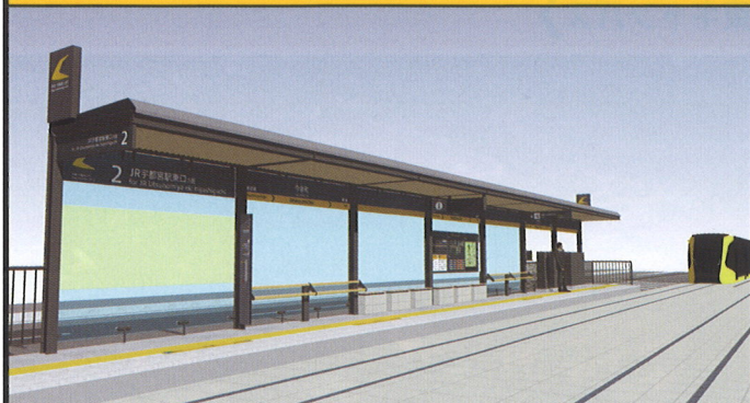
停留場のイメージ(左の壁面部にデザイン)