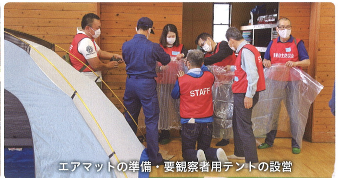
エアマットの準備・要観覧者用テントの設営