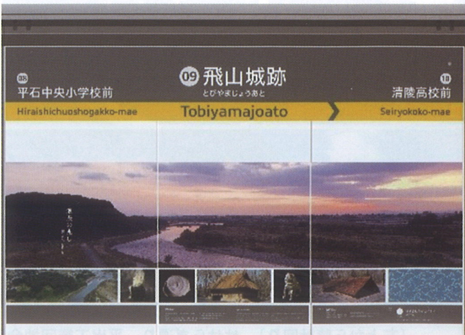
〈例〉飛山城跡停留場の壁面デザイン