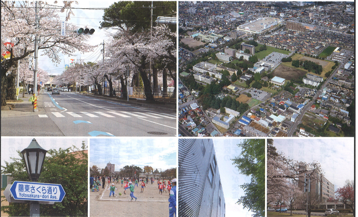
(左上から時計回り) 陽東さくら通り 宇都宮大学陽東キャンパス全景 陽東キャンパス正門 オプティクス教育研究センター(陽東キャンパス内) 陽東小学校 陽東さくら通りのガス灯