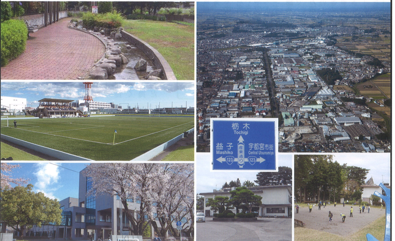
(左上から時計回り) せせらぎ通り 平出工業団地全景 ちとせ児童公園 ふれあい荘 県中央産業技術専門学校 市サッカー場