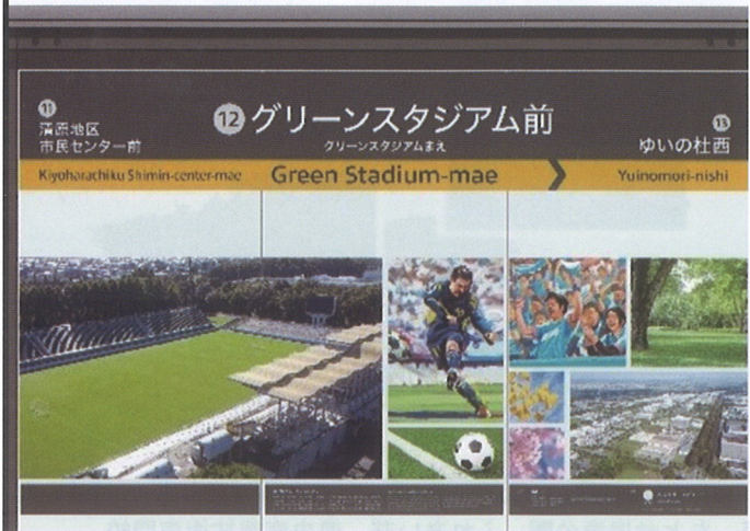
〈例〉グリーンスタジアム前停留場の壁面デザイン

FAX 028(662)6269 Eメール yoto_com@flower.ucatv.ne.jp