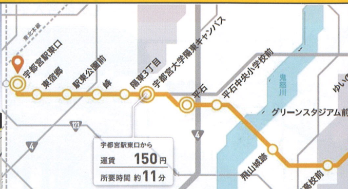
ライトライン停留場(一部)