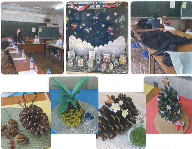
陽東キャンパスの松ぼっくりでボランティアさんが四季を演出