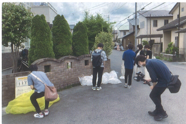
ごみステーション現地調査の様子

部の方のごみの出し方が特に悪い印象がある」「自動車で来て出していく地区外の人のマナーが悪い」などの声も寄せられました。 マナーの改善には何が有効か(3択) ごみ出しマナーの改善のために地区の住民が有効と選択したのは、①住民に対する行政の啓発活動の強化(57%)、②自治会から集合住宅の不動産仲介業者やオーナーに対する協力要請(28%)、③大学等高等教育機関を通じて在学生への啓発活動(15%)の順でしたが、自由意見では、「分別のチラシを定期的に戸別配布する」「半透明の袋と顔認証で誰のごみか分かるようにする」という声も寄せられました。 宇大生が提案する改善策 アンケートの結果を踏まえて、6年の学生は次のような改善策をまとめました。 ◆地区外の人のごみ捨て防止↓地区毎に袋の色を揃え地区外から捨てにくくする。 ◆誰が出したごみか分かるように↓袋に個人ごとに違うマスキングテープを貼る。 ◆自治会未加入者の啓発に↓分別の意義を効果的に訴えるポスターを作成する。 ◆外国人などの理解のために↓ごみの種類をピクトグラム(絵文字)で表現する。