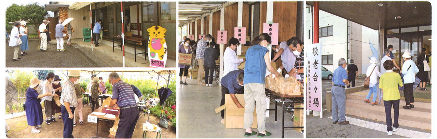
東中久保自治会/さくら台自治会