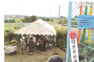
「さくらかだん」と常設テント