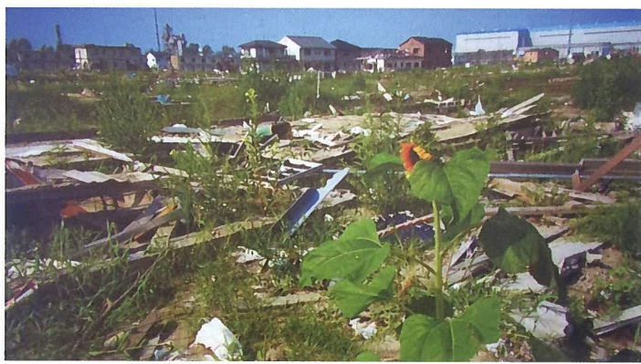
宮城県石巻市 ガレキに咲いた『ど根性ひまわり1世』

元気に頑張っている旨の返事をいただきました。「ど根性ひまわりの使命は、未来の自然災害で犠牲者を出さないことです。(中略)・・・その種を育てた未来の子どもたちが、東日本大震災のこと、自然災害のことを話すきっかけとなり、今後来るであろう大型自然災害への警鐘になればよいと思います。」という内容でした。これからも、もつともつと多くの花を咲かせ、子どもたちの健やかな成長を見守っていききたいと思えます。