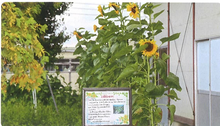
陽東小学校に咲いた『ど根性ひまわり8世』