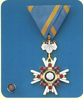
瑞宝双光章・略綬 (左)

これからも、私を支えて下さった皆様に感謝しつつ、映えある受章を心の励みに、地域の方々と共に、歩んでまいりたいと思います。