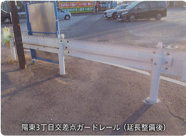
陽東3丁目交差点ガードレール(延長整備後)

今回の点検で多かった案件は、カーブミラーの設置や、薄くなった停止線(白線)等の引き直しなどでした。さまざまな事案の要望書を警