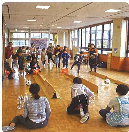
ボーリングゲーム(校内)

この新たなスローガンのもと、第42回陽東祭が10月19日(土)に開催されました。 「地域の文化祭」として、学校・地域が協力し、今年も子どもから大人まで、大勢の方々に参加していただき、大盛況を収めました。