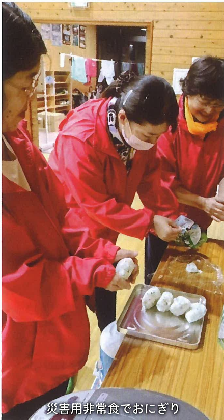
災害用非常食でおにぎり