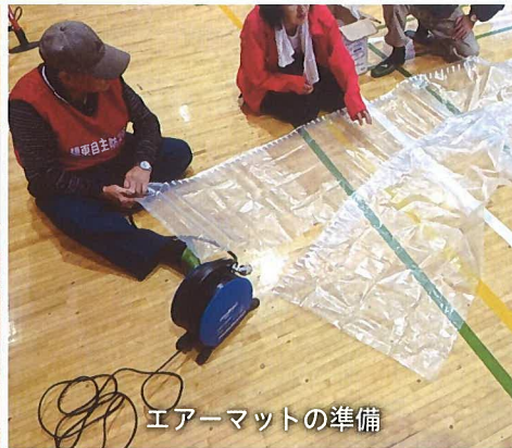
エアーマットの準備