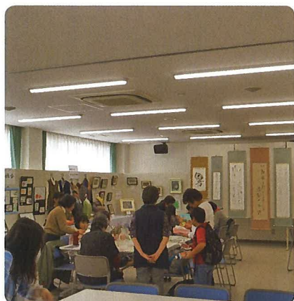
作品展示(コミセン)