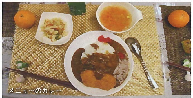
メニューのカレー