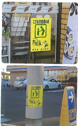
防犯ネットワークリーダー

『子ども110番の家』は、登下校時に「子どもたちが危険な目に遭った時に助けを求めて駆け込む場所、そして子どもたちを保護し、警察や学校、家庭などへ連絡するなどして、地域ぐるみで子どもたちの安全を守っていく」ことを目的に、県警と県防犯協会・市PTA連合会が推進しているボランティア活動です。陽東地区地域ビジョン策定委員会が行ったアンケートに「子どもの逃げ場所としてコンビニ活用を」という要望がありましたので、昨年12月、陽東小PTAと防犯ネットワークが協力し、宇大工学部東側とパイン公園南側のコンビニ、通学路にある会社事務所と自動車修理工場の計4箇所において新たに看板を設置させていただきました。これからも破損したり、古くなったりした看板等は順次交換していくつもりです。