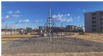
ネットクライミング