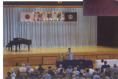
令和元年敬老会の様子

～素敵なお家から憧れのマイホームをご紹介～ 賃貸・売買 斡旋 一般建築・リフォーム