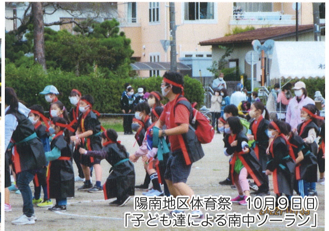
陽南地区体育祭 10月9日(日) 「子ども達による南中ソーラン」