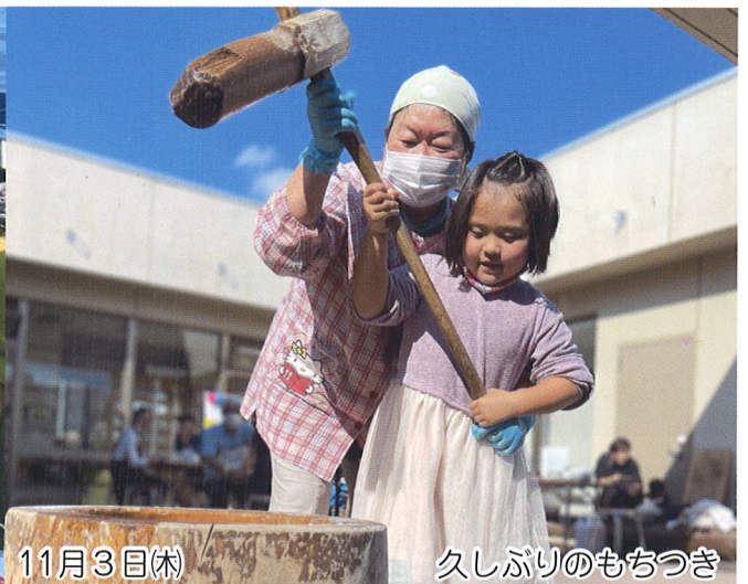
久しぶりのもちつき