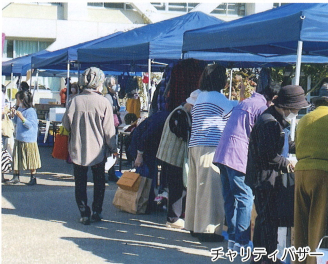
チャリティバザー 11月3日(木)