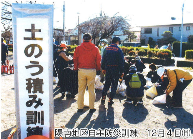
陽南地区自主防災訓練 12月4日(日)