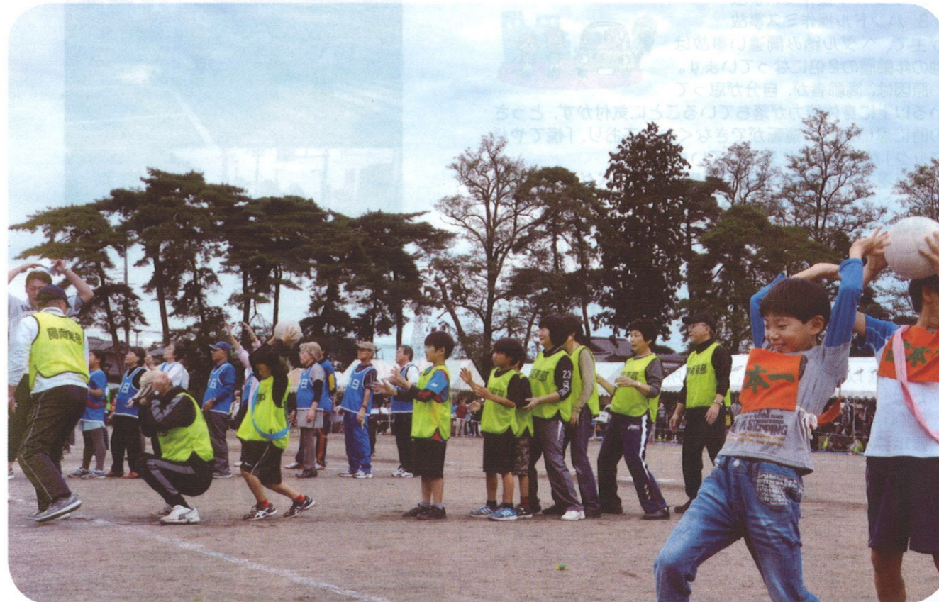
それゆけ！楽しい助け合い

発行：陽南地域まちづくり推進協議会 編集：上記広報委員会 事務局：陽南地域コミュニティセンター内