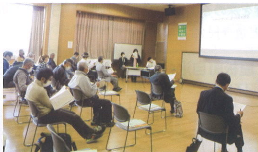
防災会報告の様子