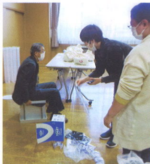
ダンボールトイレの組立て