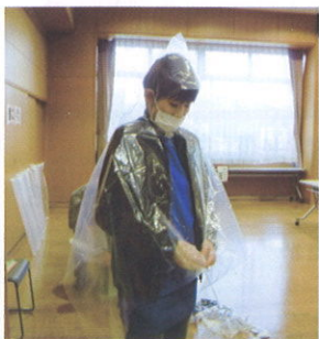
ゴミ袋で合羽づくり