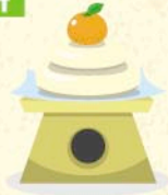
かがみ もち 鏡餅