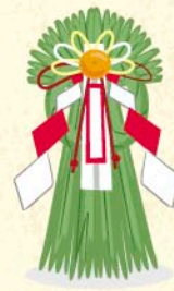
しめ かざ 注連飾り

飾ることでそれまでのけがれたものを はらい、その場を神聖なものにします… 12月30日までに飾ります(29日を除く。)