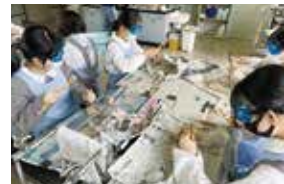
土曜講座（化石採集）