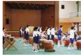
ふれあい文化教室