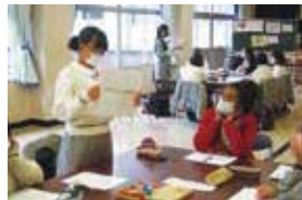
エンパワーメントプログラム