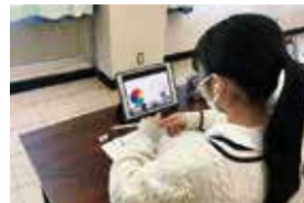
働く人に聞く（オンライン）