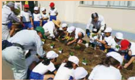
雀宮南小学校/「菜園ボランティア」