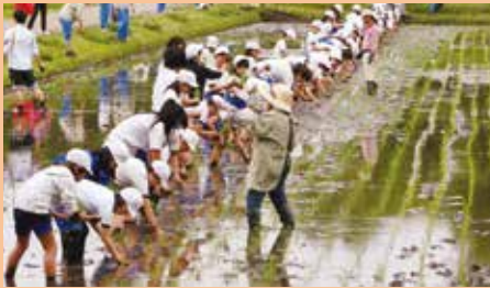
清原南小学校/「高田沼公園を愛する会」 「農業インストラクター」「こもりやグリーン倶楽部」