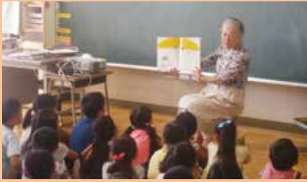
城山東小学校/「にじいろの会」