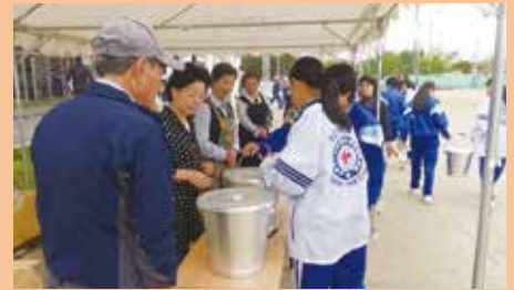
一条中学校/自治会、消防団、消防署、PTAなど