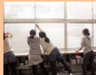
峰小学校/「株式会社サニクリーン宇都宮」