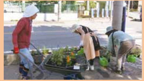
姿川中央小学校/「姿央助っ人団」