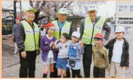
戸祭小学校/「とまつりパトロール会」