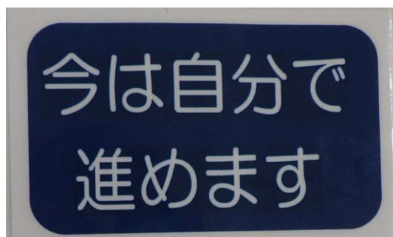
「ヘルプカード」 宮の原中学校地域協議会