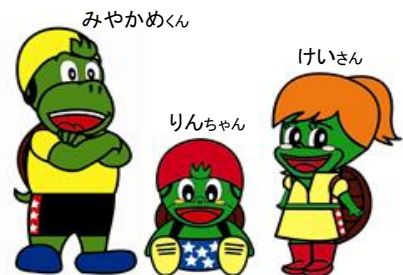
▲みやかめファミリー