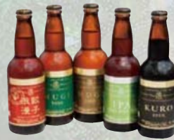
我们推荐的自造啤酒。不尝不能走。

有 48 公顷广大的产地里，除了农产品销售处，使用本地食材的餐厅以外，还具有可体会农业的农场，森林，多功能厅，温泉广场，游泳池，酒店等的逗留性的道之驛。园里可分三大地方。村落区是买东西，餐饮，多体验，温泉酒店为主。森林区是 10 公顷的广大自然森林为主。乡下区除了广大草地广场以外，还有体验农场，生产农场，可体验农业的娱乐为主。在餐厅里可尝使用本地食材的菜，也可以打包各种美食。这里不只是休息处，也可以享受各种各样的娱乐。