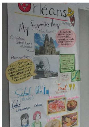
宇都宮市の高校生によるポスター展示

オルレアン市の概要・歴史・文化・食文化・イベント・観光・特産物、オルレアン市の日本の影響、オルレアン市が与えた影響、フランスの学校生活、フランス語の発音