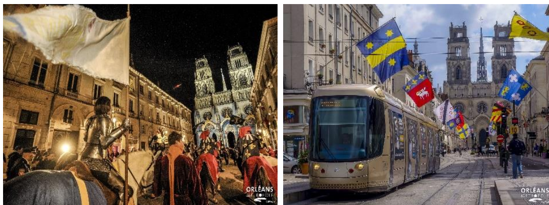
ジャンヌ・ダルク祭中の街並