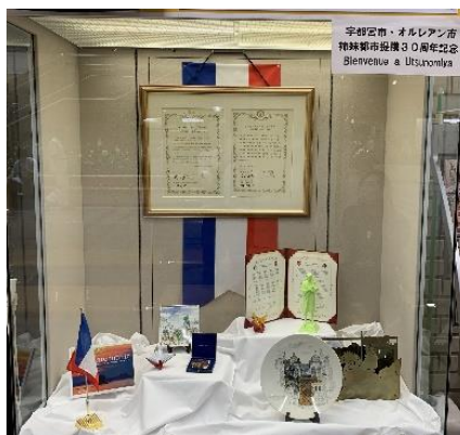
オルレアン市PRブース