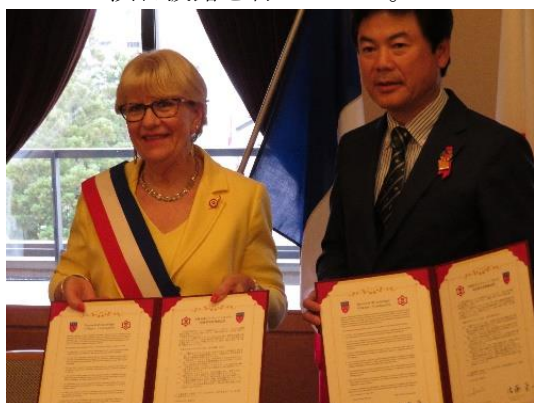
オルレアン市副市長と宇都宮市長

※ 歓迎レセプションにおいて，日本文化紹介として「邦楽ゾリスデン」による邦楽の演目披露を行いました。