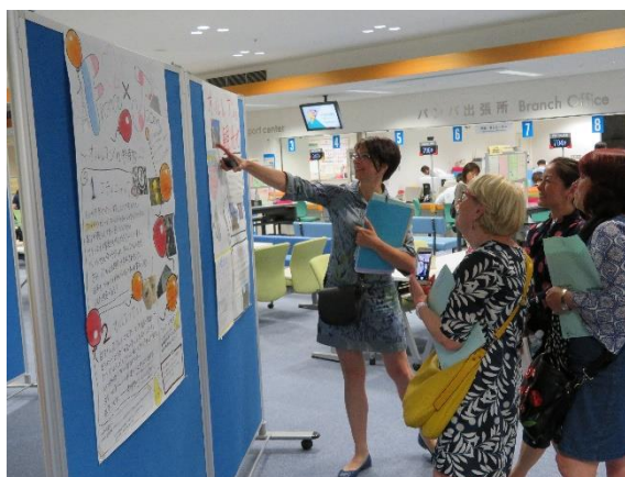
ポスター展示の観覧