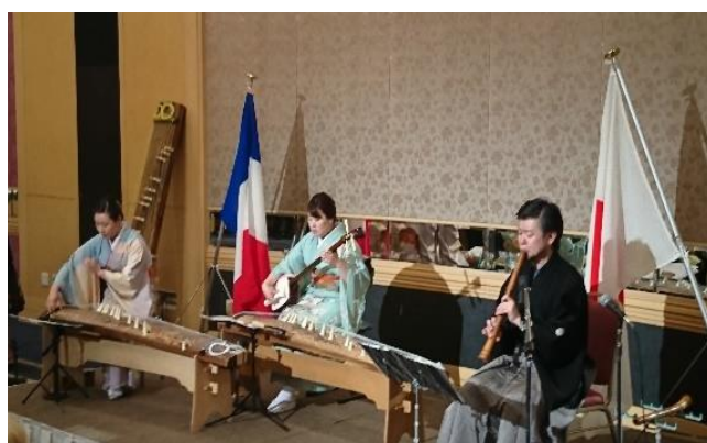
邦楽ゾリスデンによる演目披露