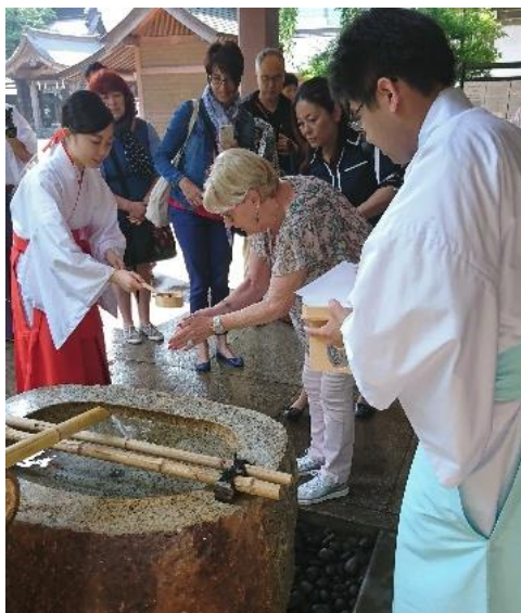
二荒山神社への参拝