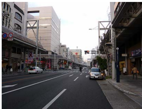
まちづくりセンターがある神田町通り