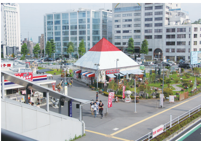
▲JR宇都宮駅東口地区の様子

○宇都宮市地区計画区域内における建築物の制限に関する条例の一部改正 議案の概要 軌道整備事業の推進のための宇都宮駅東口地区地区計画の変更