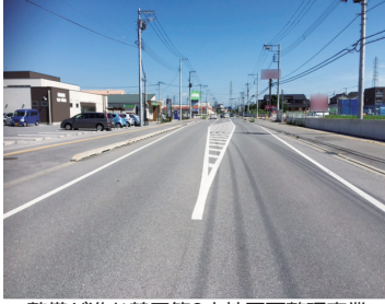
▲整備が進む鶴田第2土地区画整理事業