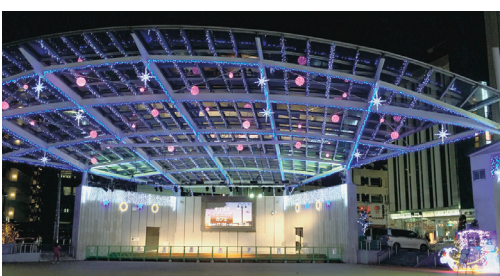
▲ライトアップしたオリオン市民広場（オリオンスクエア）