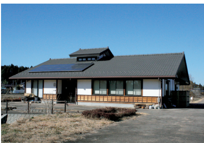
▲西鬼怒川地区グラウンドワーク活動センター