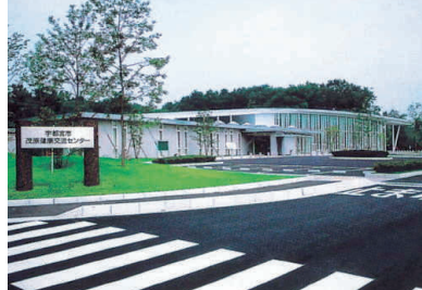
▲茂原健康交流センター