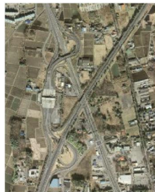
▲宇都宮インターチェンジ周辺

第2次市都市計画マスタープランにおいて、広域交通の結節機能を活かし、産業・流通準拠点としての形成を図るべき地域として、これまで民間主体による流通業務施設などの誘導を促してきたところであり、将来的には、新たな産業ニーズや地域振興のための交流機能の配置など、計画的な土地利用を図ることとしている。