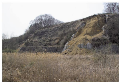
▲飛山城史跡公園の崖崩れの様子

○学校給食の食材の放射線量測定に関する陳情書書の概要 『給食食材の放射線量検査が実施できる