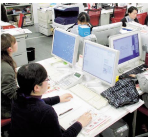
▲緊急雇用創出事業での雇用者の研修の様子