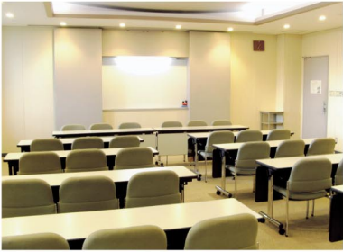
▲使用料が改定される東市民活動センターの会議室