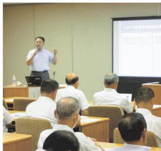
▲議員研修会の様子